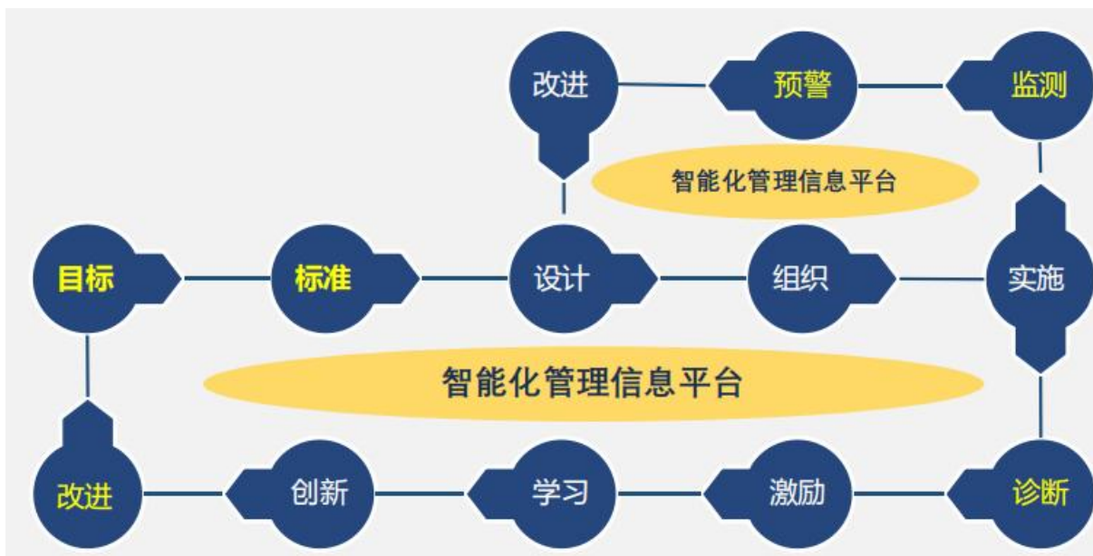
图 2 专业诊断与改进图

2. 完善教学管理机制，加强日常教学组织运行与管理，定期开展课程建设水平和教学质量诊断与改进，建立健全巡课、听课、评教、评学等制度，建立与企业联动的实践教学环节督导制度，严明教学纪律，强化教学组织功能，定期开展公开课、示范课等教研活动。专任教师一学期须听课评课 4 次，每学期应保证有 20% 教师开展公开课、示范课教学活动，新教师必须实行一对一指导一年；教师若发生教学事故，不得参与当年评优评先，年度考核不高于合格等次。