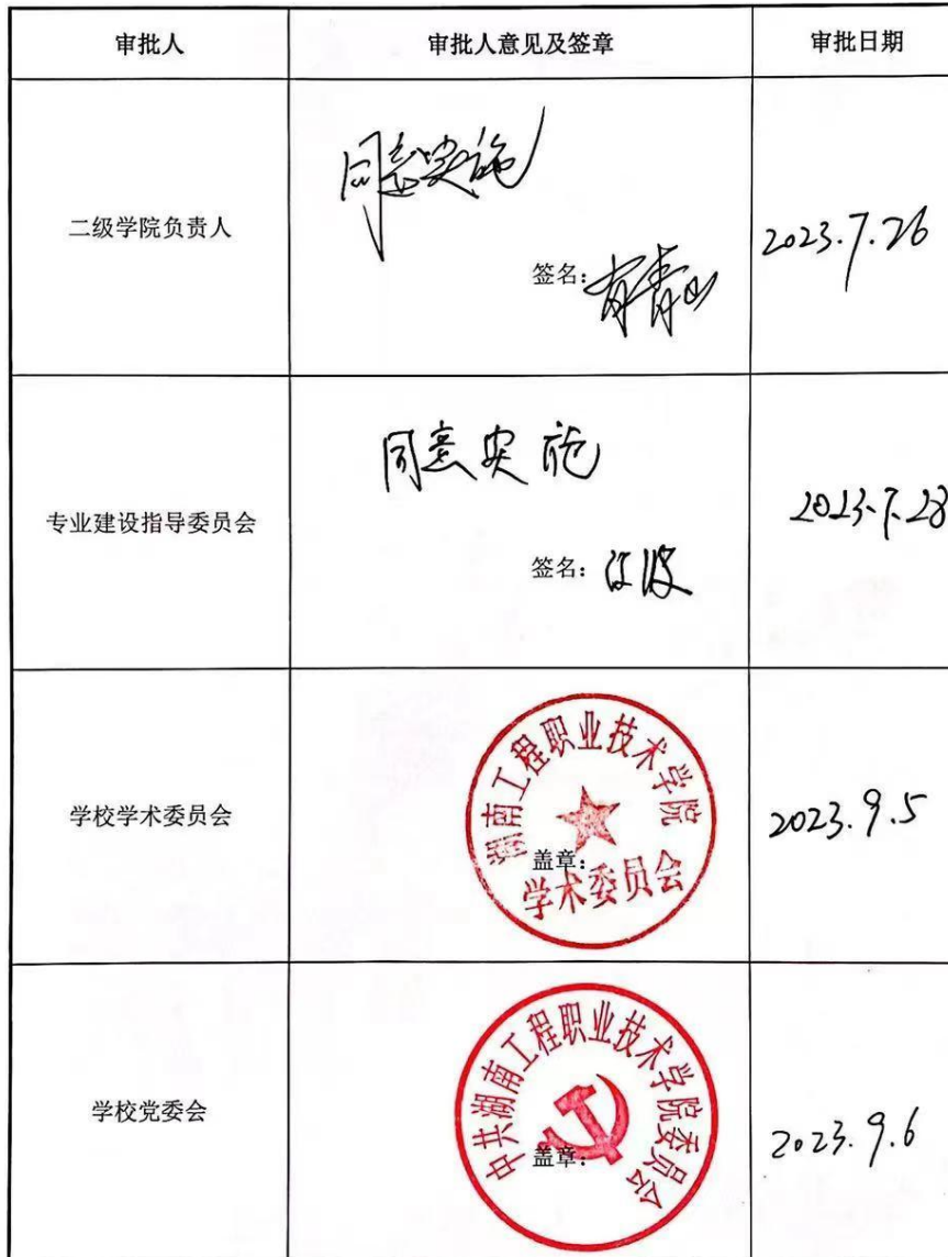
旅游管理专业（生态旅游方向）专业人才培养方案审定表