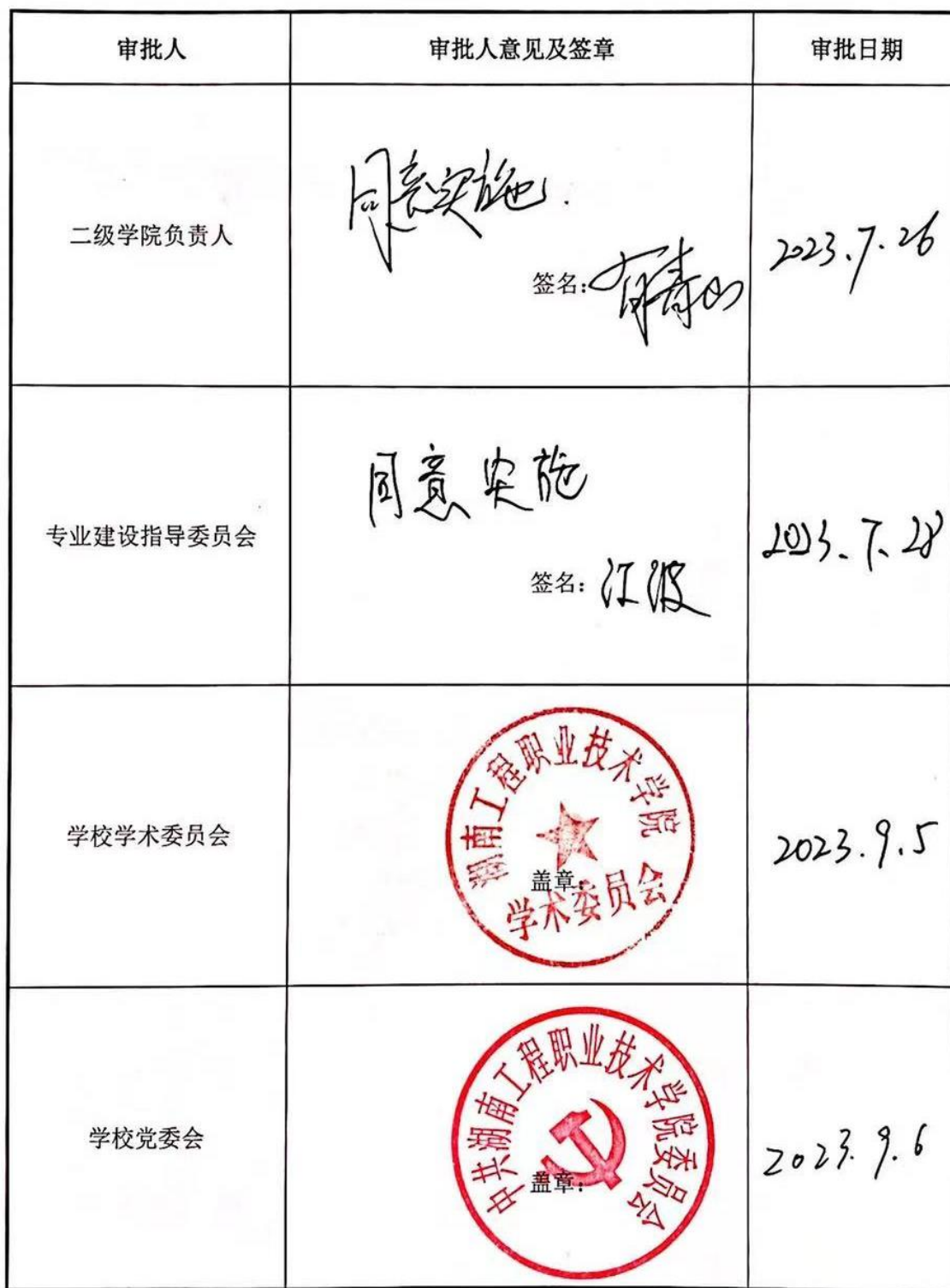
旅游管理专业专业人才培养方案审定表