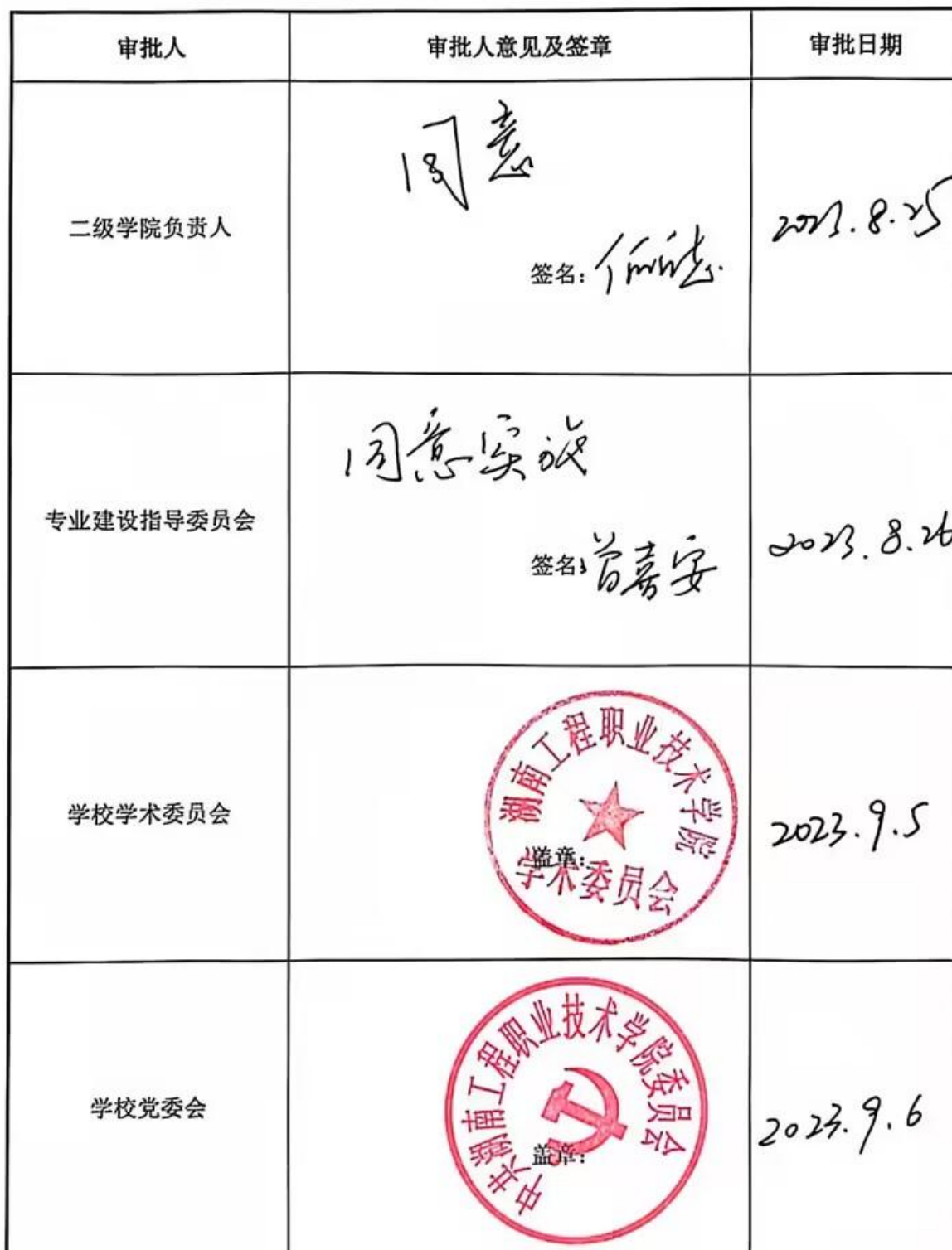
房地产经营与管理专业人才培养方案审定表