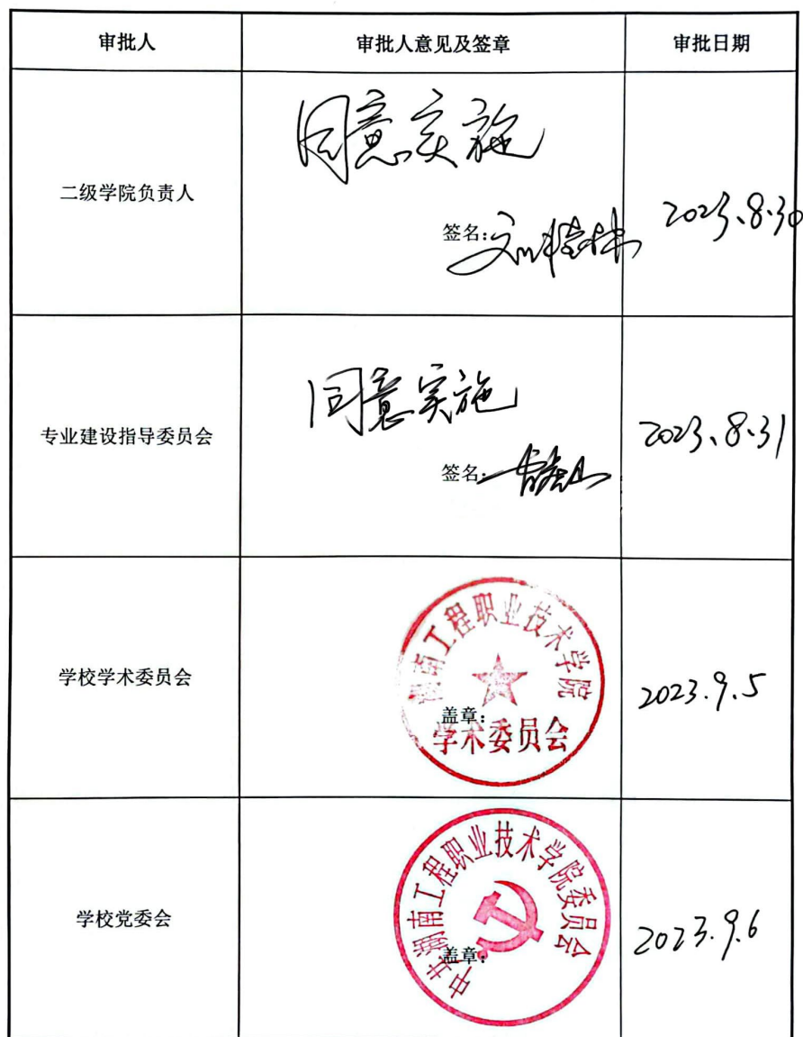
电子信息工程技术（自动化控制方向）专业人才培养方案审定表