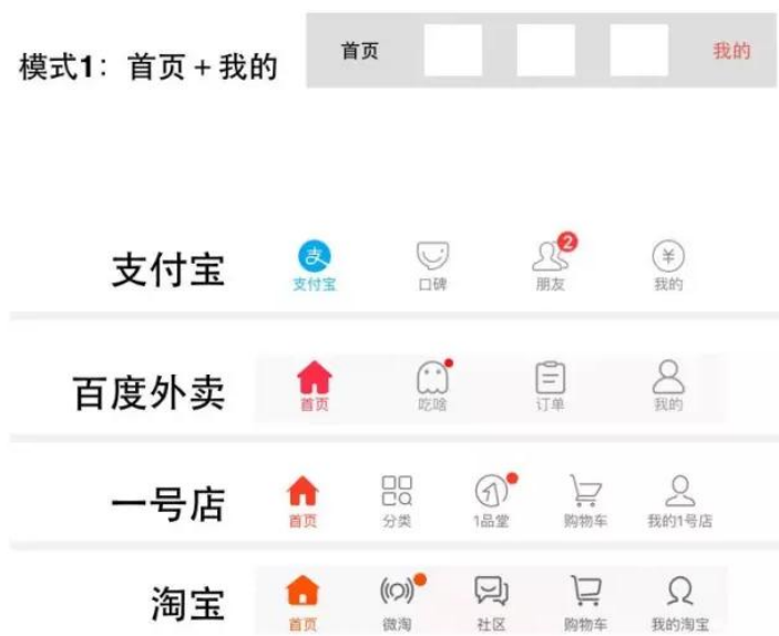
图 1 导航栏效果图

你自己想要开发一个视频播放器的APP,要求你参照图片模式(见图1)为该视频播放器设计一个在基于IOS平台的导航栏,所有的功能图标要求使用面形图标设计。