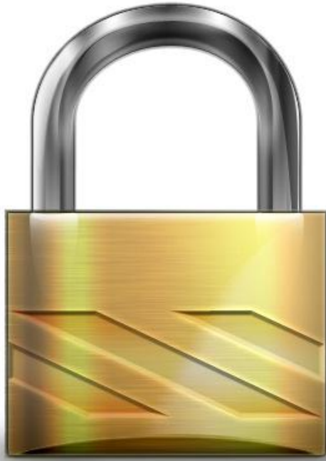
图 1 锁的图片