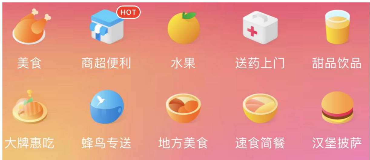
图 1 功能图标效果图