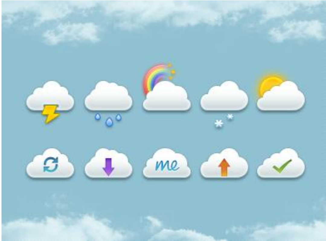
图 1 应用图标效果图