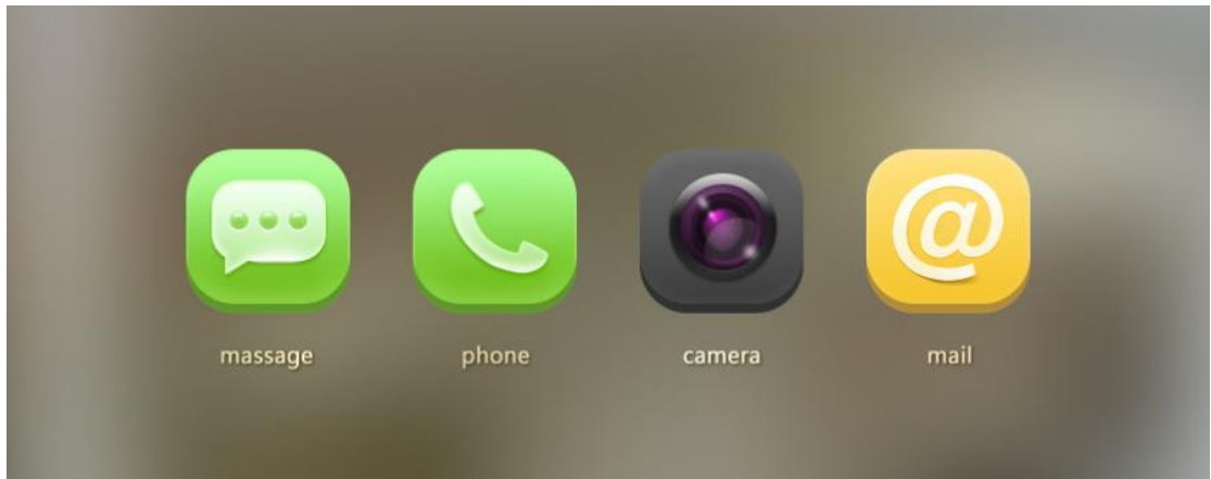
图 1 应用图标效果图