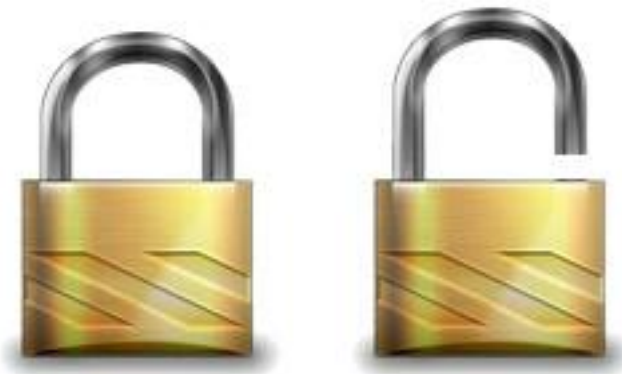
图 2 按钮锁定状态和打开状态